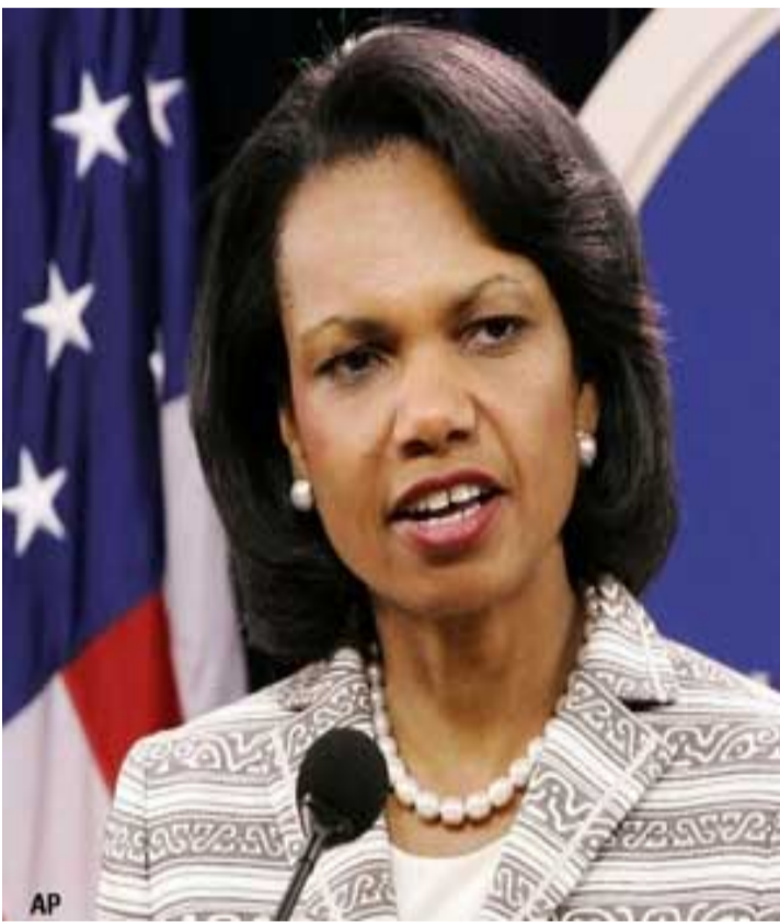
پاريزهر سهلاح کانهبې سه معيد